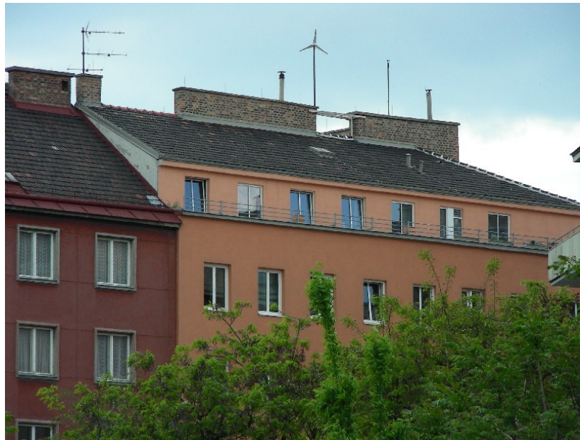
Wienrad und Windmessgerät rechts vom Windrad

Das Kleinwindrad wurde in ca. 28 m Höhe über dem Umgebungsniveau von 171 m Seehöhe und ca. 3,15 m über dem Dachgiebel des sechsstöckigen Mehrfamilienhauses zwischen 2 Kaminreihen, rund 2,3 m über der Kaminoberkante installiert.